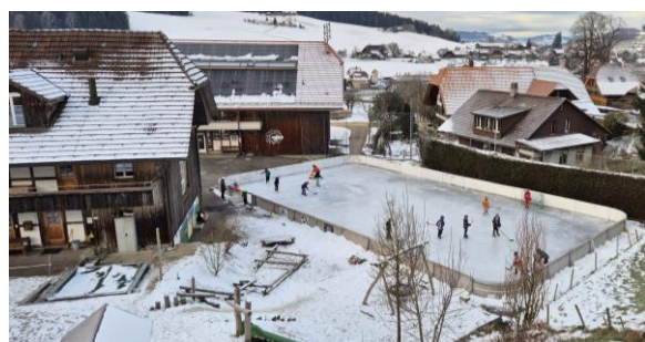
Turnstunde 1. – 3. Klasse