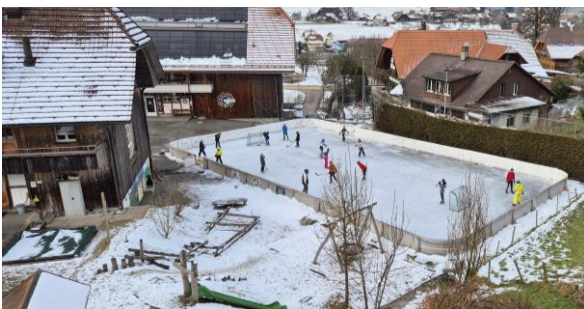
Turnstunde 4. – 6. Klasse

Vielen Dank an die fleissigen Helfern:innen, welche zu später Stunde und am frühen Morgen dieses tolle Natur-Eisfeld gepflegt haben!